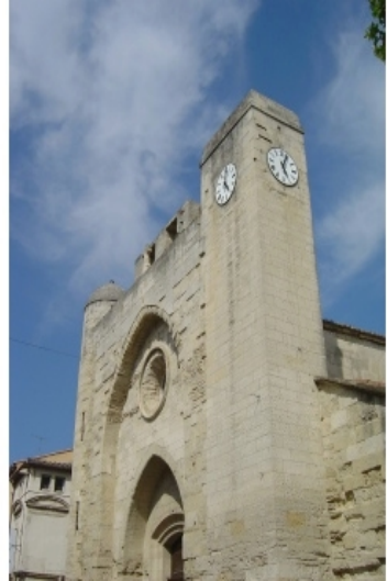
Stadtwälle in Aigues-Mortes