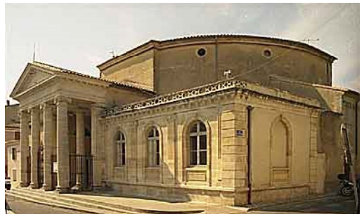
Der Grand Temple in Vauvert