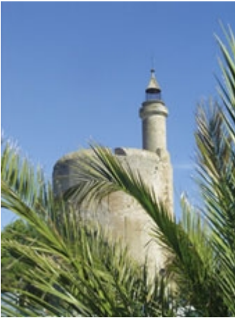
der Constance Turm